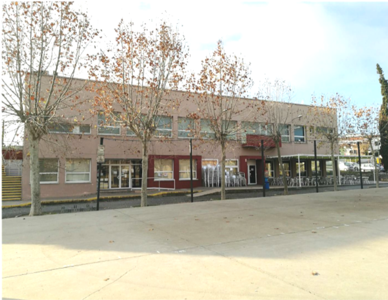
L'edifici del Casal acollirà el centre de dia

Canyelles ha aprovat un pressupost de 6,3 milions d'euros que fa possible tirar endavant grans projectes com el nou pavelló municipal, el centre de dia o el Mi-