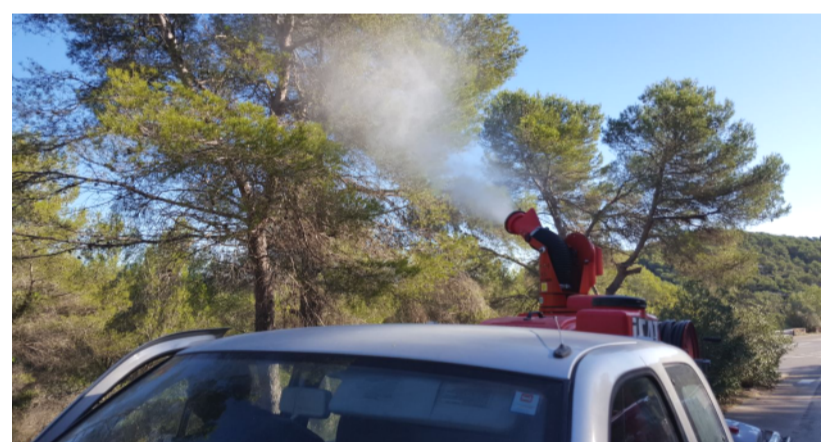
El tractament s'ha fet amb productes biològics.

L'Ajuntament de Canyelles actua durant tot l'any per prevenir la processonària del pi. Periòdicament s'actua a tots els nuclis habitats del municipi i també als camins rurals del seu entorn,