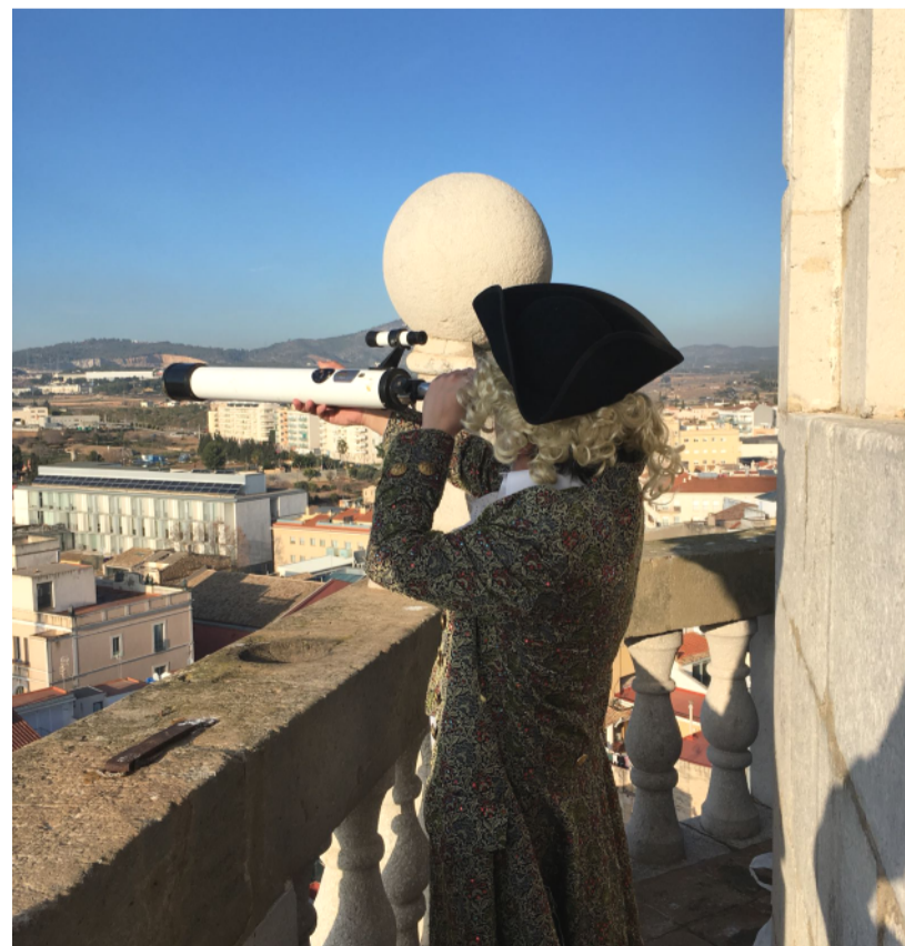
El Carnestoltes buscant el millor camí per arribar a Canyelles