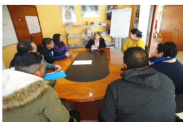
Els beneficiaris amb l'alcaldeessa

Cinc aturats han trobat feina a Canyelles gràcies al programa Formació i Treball del SOC, que gestiona el Consell Comarcal, i al qual està adherit l'Ajuntament de Canyelles.◆