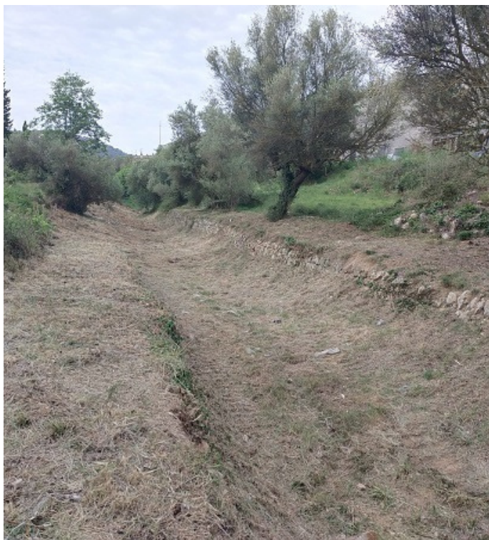
Actuacions de neteja a la riera de Can Dori

Les actuacions es fan gràcies a una subvenció de l'Agència Catalana de l'Aigua. Aquests dies s'ha actuat a la riera de Can Dori i a la riera de Vilafranca. Les actuacions es repetiran a altres punts del municipi.