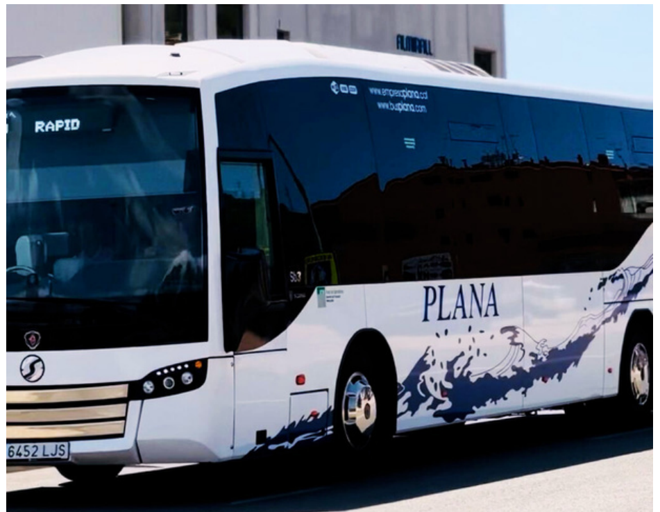
Autobús de la línia Vilanova-Vilafranca al seu pas per Canyelles