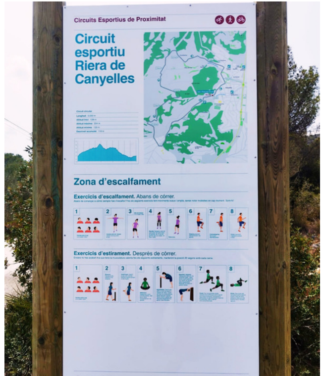
Inici i final del recorregut circular

S'inclou en un projecte pilot que es fa en col·laboració amb la Diputació de Barcelona que també permet millorar la senyalització dels itineraris municipals amb actuacions sostenibles i respectuoses amb el medi ambient.