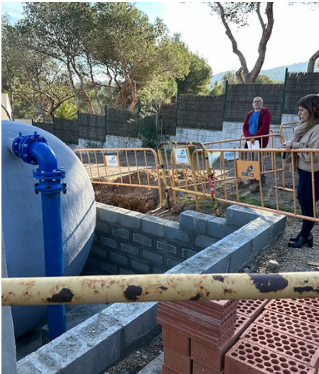
Visita d'obres als treballs de la xarxa d'aigua

Entre les accions que ja s'han tirat endavant hi ha el carril bici que dona accés a la zona escolar, o la declaració de Canyelles com a poble amic dels animals, o a favor del voluntariat.