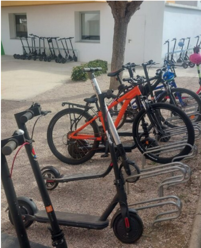
Nou aparcament de patinets i bicicletes a l'institut